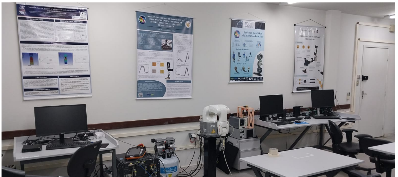
Imagem do LabGuará

Por se tratarem de pesquisas muito recentes, o embasamento teórico basicamente envolve a busca de artigos científicos e tentativa e erro. Por isso, é desejável que o aluno interessado em realizar projetos de pesquisa no laboratório seja independente e autodidata, além de interessado para correr atrás do que for necessário e enfrentar qualquer possível desafio.