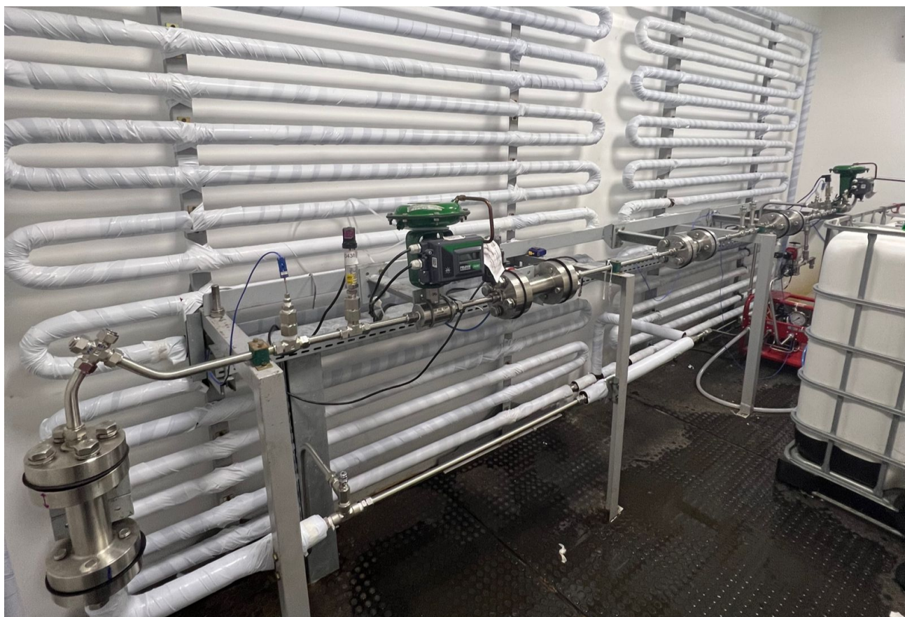
Imagem da serpentina onde circulam os fluidos experimentais na oficina do LAMEFT