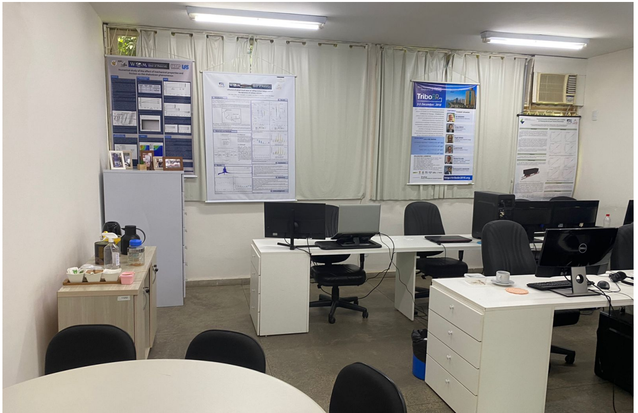
Imagem do LabTDF

Alunos interessados em entrar no laboratório devem gostar de programação, pois é uma parte extremamente necessária nos projetos desenvolvidos, além do desejo de aprender simulação computacional. É ideal possuir base em programação em Python, mas não é um requisito necessário, assim como estar do 4º período em diante. Além disso, o mais importante é o interesse em aprender e desenvolver novas habilidades.